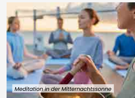
Meditation in der Mitternachtssonne