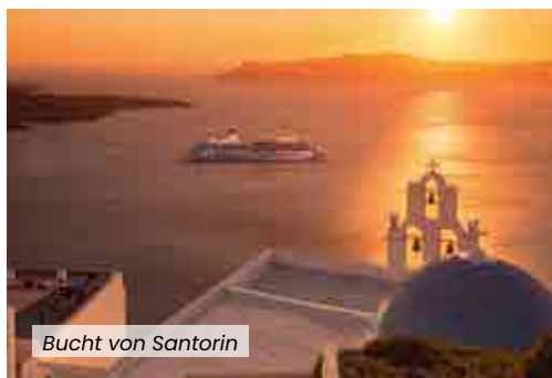
Bucht von Santorin

Der Sonnenuntergang über Santorin ist einer der schönsten der Welt, und wenn man ihn vom Meer aussieht, ist er noch viel schöner. Die Sonne geht langsam unter und erzeugt unglaubliche Schattierungen am Himmel. Halten Sie die Einzigartigkeit des Panoramas auf einem Foto fest, während Sie an Ihrem Lieblingsaperitif nippen. Es erwartet Sie eine Show, die Sie nicht verpassen sollten, ein Moment, der Sie sprachlos machen wird.