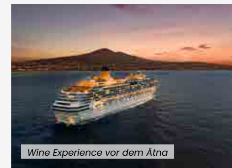
Wine Experience vor dem Ätna