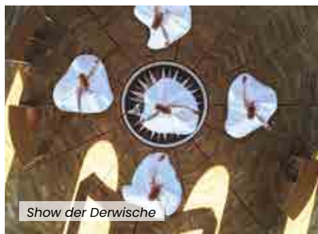
Show der Derwische