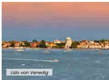
Lido von Venedig