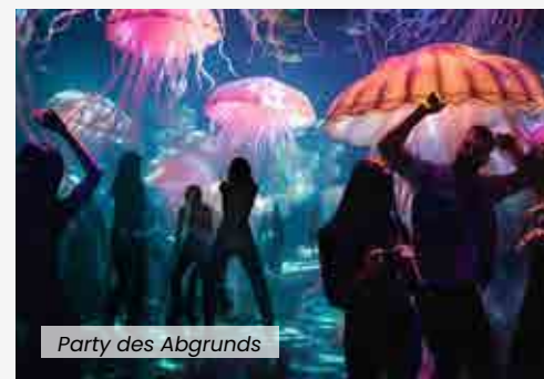
Party des Abgrunds

Der Ätna, das pulsierende Herz Siziliens, ist der Star dieses Augenblicks, und mit ihm die besten Weine der Insel. Schenken Sie sich den Wein direkt aus den Fässern ein und entdecken Sie mit jedem Schluck das reiche und vielfältige Ökosystem dieser Region. Ein Weinfest, das Sie direkt in die Essenz der sizilianischen Aromen und die Atmosphäre der lokalen Weinlokale führt.