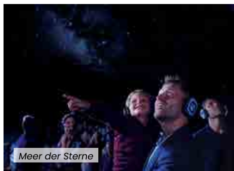
Meer der Sterne