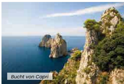
Bucht von Capri

Eine Lichtshow enthüllt die Geheimnisse einiger der faszinierendsten Meeresbewohner: Wale, Delfine und Buckelwale. Eine innovative Show aus einem einzigartigen Blickwinkel: dem des Schiffes auf dem offenen Meer. Sie werden sprachlos sein.